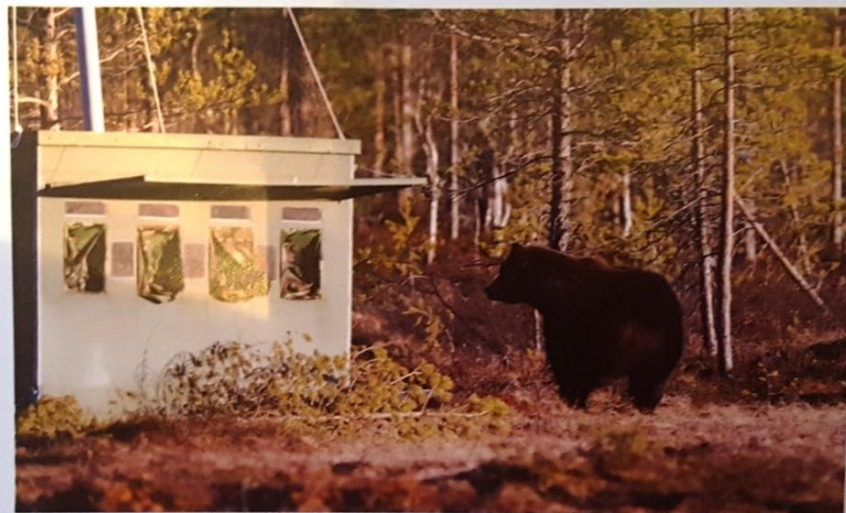
The most photogenic subjects reside in the wild in Taiga.